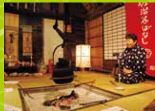
鳥取市無形民俗文化財「佐治谷話」の様子