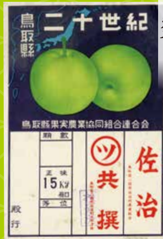
ラベル「二十世紀梨」個人 蔵