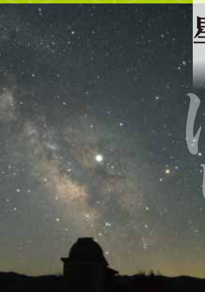
写真「夏の天の川(平成31年4月撮影)」