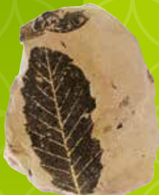
辰巳峠植物化石(シキンマナラ) 鳥取市佐治歴史民俗資料館蔵