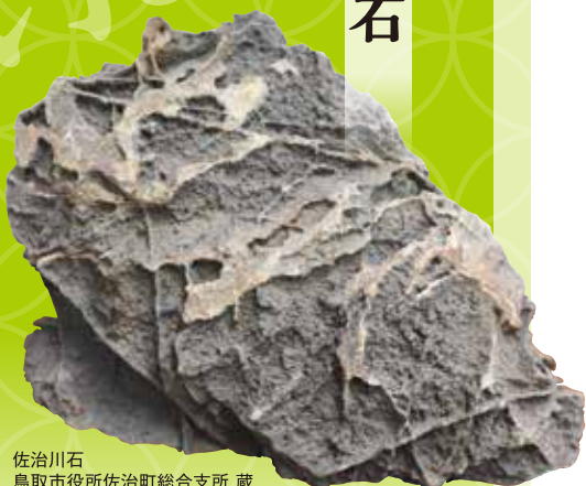
佐治川石 鳥取市役所佐治町総合支所 蔵