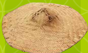
国登録有形民俗文化財「板笠」 鳥取市佐治歴史民俗資料館蔵