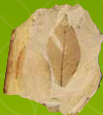
辰巳峠植物化石(ムカシバナ) 鳥取市佐治歴史民俗資料館蔵