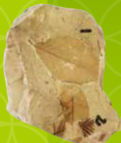
辰巳峠植物化石(ムカシヌカラムツ) 鳥取市佐治歴史民俗資料館蔵