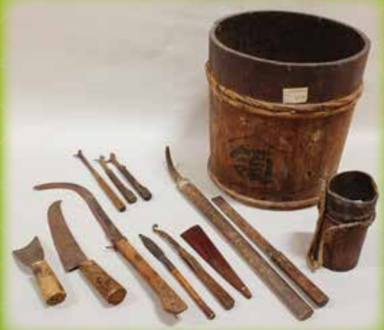
鳥取市指定有形民俗文化財 佐治の漆掻き用具 鳥取市佐治歴史民俗資料館蔵