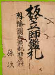
国登録有形民俗文化財「板笠師鑑札」 鳥取市佐治歴史民俗資料館蔵