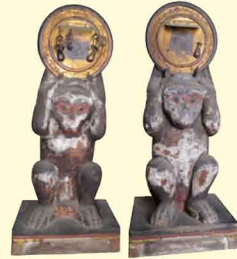
神猿像(雄猿・雌猿) (玉泉寺蔵) ※雄猿像のみ展示

これまで鳥取であまり注目されてこなかった天正9(1581)年から慶長5(1600)年までの時代、いわゆる豊臣期と言われる時代の因幡についての展覧会です。宮部継潤や亀井茲矩を中心に、文禄・慶長の役(壬辰戦争)や関ヶ原の戦いなど、当時の重大事件についても紹介します。