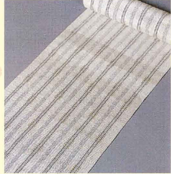
「紙布帯地」 2015年 山下 健 (県指定無形文化財 「紙布」保持者)