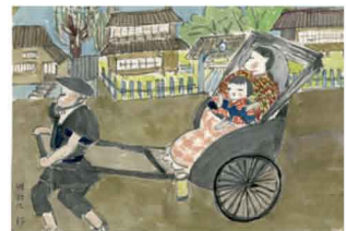
おばあちゃんの見た大正・昭和の鳥取

鳥取市歴史博物館やまびこ館では、これまでの展覧会で作成した解説パネルや、写真パネルの貸出しを行っています。小・中学校の学習や公民館等、社会教育施設でご活用ください。