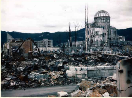
「爆心直下から広島県産業奨励館(原爆ドーム)を望む」