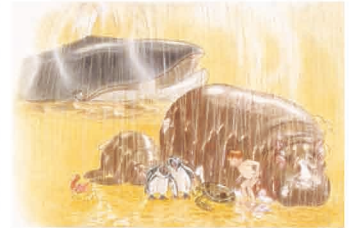
おふろだいすき (1982年) 松岡享子 作 / 林明子 絵 / 福音館書店刊