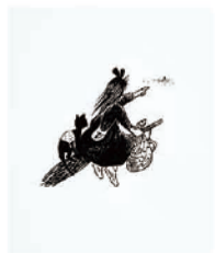
魔女の宅急便 (1985年) 角野栄子 作 / 林明子 絵 / 福音館書店刊