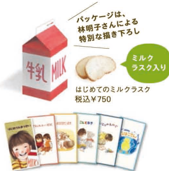
A6クリアファイル (全6種) 税込¥200