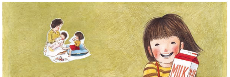
はじめてのおつかい (1976年) 筒井頼子 作 / 林明子 絵 / 福音館書店刊

本展では、林さんの代表作「はじめてのおつかい」「こんとあき」から最新作「ひよこさん」までの絵本原画のほか、林さんがイラストレーターとして活動していた時の貴重な作品や角野栄子さん作「魔女の宅急便」に添えた挿絵など、約200点の原画や資料を展示します。カラーインクや色鉛筆で繊細に描かれた美しい原画とともに、林さんが描く温かで懐かしい絵本の世界をどうぞお楽しみください。