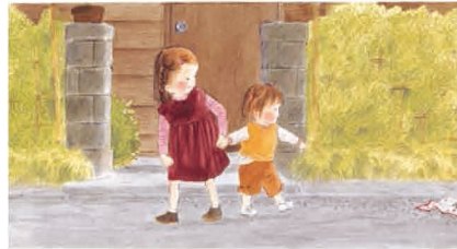
あさえとちいさいもうと (1979年) 筒井頼子 作 / 林明子 絵 / 福音館書店刊