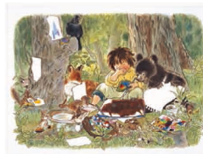
まほうのえのぐ (1993年) 林明子 作・絵 / 福音館書店刊