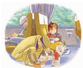
こんとあき (1989年) 林明子 作・絵 / 福音館書店刊