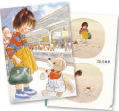
A4クリアファイル (こんとあき) 税込¥400