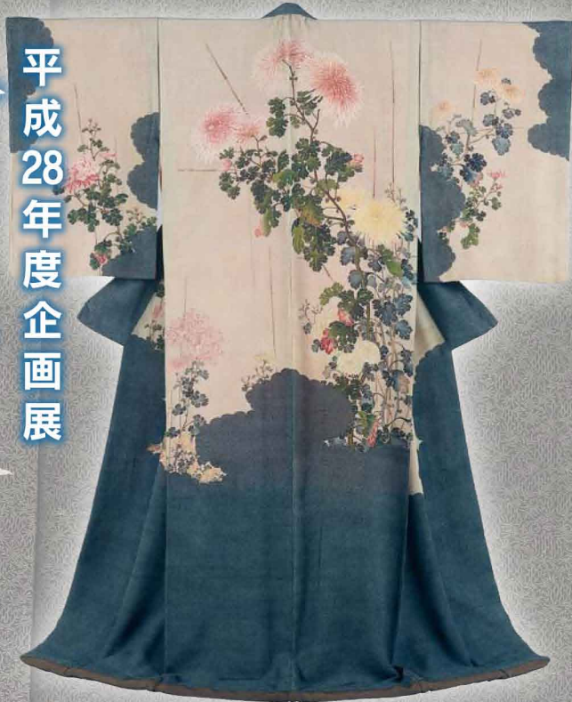
染分縮緬地重ね菊枝小紋に菊模様着物 京都府 蔵(京都文化博物館管理)