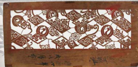
鈴鹿市指定文化財 伊勢型紙「鶴丸紋に寿」 鈴鹿市 蔵