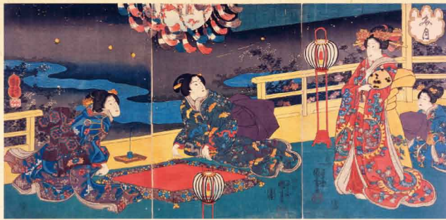
歌川国芳「文月」(鳥取市歴史博物館所蔵)