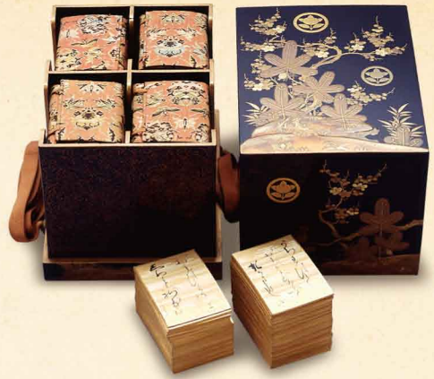
松竹梅橘紋詩絵カルタ箱(鳥取県立博物館所蔵)