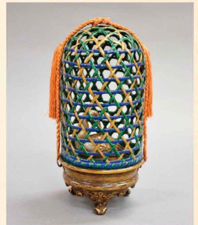
色絵鳥籠形香炉 (鳥取県立博物館所蔵)