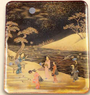
研出金詩絵虫狩図硯箱(渡辺美術館所蔵)