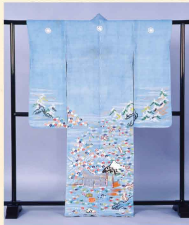
淡浅葱麻地御所解文様帷子 (鳥取県立博物館所蔵)