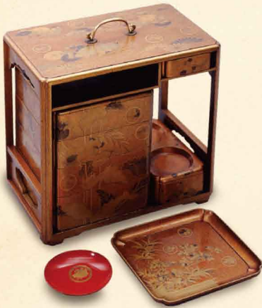
菊水菱詩絵花見弁当 (鳥取県立博物館所蔵)