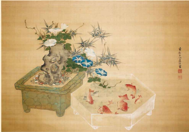
渡辺玄対「朝顔と金魚」(渡辺美術館所蔵)