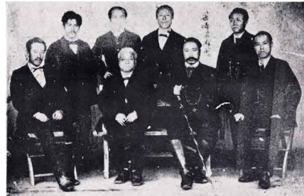
鳥取県再置に尽力した人々(当館所蔵)

平成28年(2016)は、明治9年に鳥取県が廃県し島根県となってから140年、明治14年に鳥取県が再置されてから135年と、廃県と再置ともに節目を迎えます。先人たちの「故郷・鳥取に対する熱い思い」を紹介します。