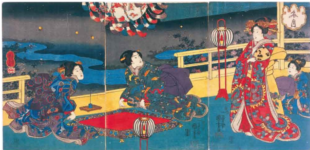
歌川国芳「文月」(当館所蔵)

樽谿のホタル飛翔の時期にあわせて、錦絵や調度品などをご紹介します。江戸時代の蛍狩りの情緒にひたってください。