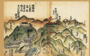
羽柴秀吉鳥取城攻布陣図(当館所蔵)