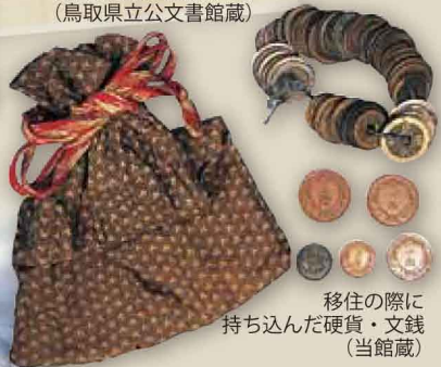
移住の際に 持ち込んだ硬貨・文銭 (当館蔵)