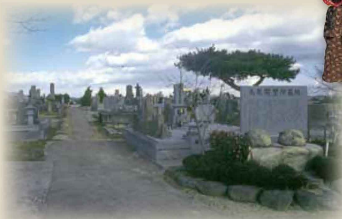
鳥取開墾所墓地 (福島県郡山市)