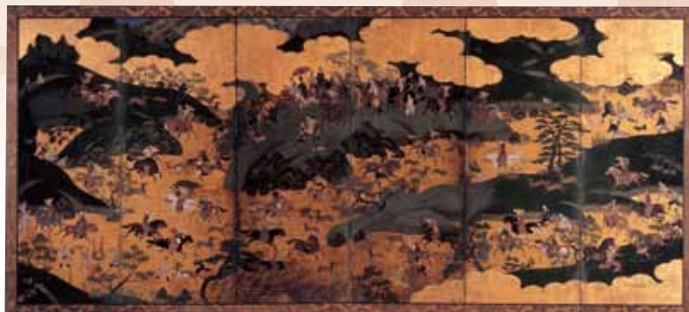
曾我物語図屏風-右隻(渡辺美術館) | 三大仇討のひとつ曾我物語を題材にした桃山時代の屏風。

「伊賀上野の仇討ち」として知られる、荒木又 右衛門の活躍と鳥取藩とのつながりや、仇討を テーマに作られた屏風絵など、歴史資料や初公 開の作品からご紹介します。