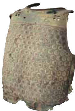
河合又五郎所用具足(萬福寺)