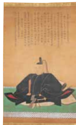
松平忠明像 (天祥院) | 大和郡山藩主。荒木又右衛門を剣術師範役として召し抱える。