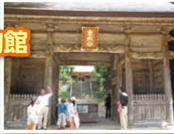
鳥取東照宮 (随神門)

場所 鳥取市歴史博物館 時間 30分～1時間 内容 中世～近世の鳥取のお殿さまについて解説します。江戸時代の鳥取藩の成り立ちや藩主池田家について解説します。また、池田家だけでなく、室町時代の守護大名・山名氏や、天正9年鳥取城攻めの後に因幡に入った、豊臣秀吉の時代の大名・宮部継潤、亀井茲矩など、因幡地域各地の「お殿さま」について対応可能です。