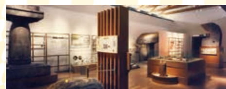
鳥取市因幡万葉歴史館展示室

場所 鳥取市因幡万葉歴史館 時間 1時間程度 内容 因幡国府で花ひらいた古代の文化や貴重な遺跡、麒麟獅子舞や因幡の傘踊りなど民俗文化の解説をします。