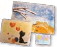
体験による オリジナル和紙