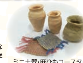
ミニ土器・麻ひもコースター

場所 鳥取市青谷上寺地遺跡展示館 時間 見学30分～・体験30分～ 内容 青谷上寺地遺跡から出土した貴重な品々を見学して、弥生時代について学びます。ものづくり体験も可能です。 ※体験参加人数によっては、受け入れ時期、体験場所の調整が必要になります。お早目にご相談下さい。 ※土笛づくり・ミニ土器づくりは乾燥に数日かかります。