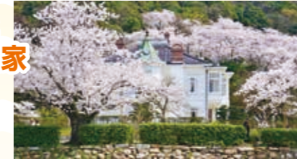
国指定重要文化財 仁風閣

場所 仁風閣 史跡鳥取藩主 池田家墓所 時間 1時間～3時間 内容 国重要文化財である仁風閣はいつ、なぜ建てられたのか、その歴史をひもとくと、現代の鳥取の町の歴史につながっていきます。近代鳥取の動乱をみつめた仁風閣から、地域の歩みをふりかえります。 ※歴代藩主の眠る史跡池田家墓所への見学も可能です。