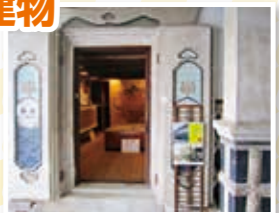
企画展示に使われる西蔵

場所 城下町とっとり交流館 高砂屋 時間 30分～1時間 内容 明治時代の商家の建物と蔵を見学して、建物のつくりと当時の鳥取の城下町の様子について学ぶことができます。