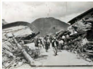
鳥取大地震後の智頭街道

場所 鳥取市歴史博物館 時間 30分～1時間 内容 鳥取で起こった災害、地震、火事について、鳥取大地震(1943)、鳥取大火(1952)を中心にご案内します。被害状況を写した古写真や映像などをご覧いただき、災害から見た、江戸時代～現代までの鳥取のあゆみについてもご案内いたします。